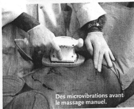
Des microvibrations avant le massage manuel.