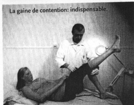
La gaine de contention: indispensable.